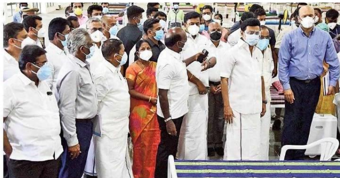
Chief Minister M.K. Stalin inspecting newly-added beds at the Covid Care Centre at Codissia Trade Fair Complex in Coimbatore on Thursday.

On his maiden visit to Coimbatore after becoming the Chief Minister, Mr. Stalin inaugurated new beds added to the Covid Care Centre (CCC) at the CODISSIA Trade Fair Complex and a new 360-bedded CCC at Kumaraguru College of Technology (KCT). The CCC at the trade fair complex was functioning