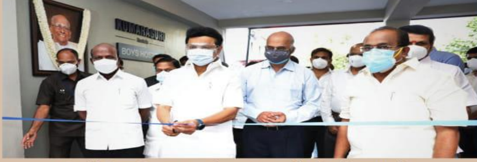
Covid Care Centre was inaugurated by the Honourable Chief Minister of Tamil Nadu Thiru M.K.Stalin on 20 May, 2021